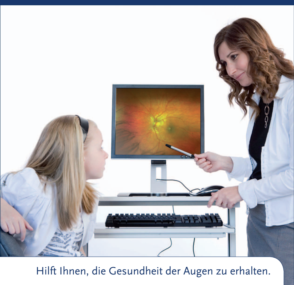
Hilft Ihnen, die Gesundheit der Augen zu erhalten.

Wir alle wollen für unsere Kinder das Beste und gutes Sehen ist wesentlich für ihre körperliche und geistige Entwicklung. Die meisten Kinder haben gesunde Augen, aber einige werden mit Augenerkrankungen oder Störungen geboren, die nicht unbedingt offensichtlich sind. Anzeichen anderer Krankheiten, wie Diabetes, können ebenfalls auf der Netzhaut sichtbar sein.